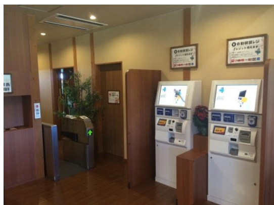
酒々井温泉湯楽の里様

ポストシステムズは本特許の専用実施権の取得により、今後とも温浴施設の人件費の高騰、人材不足の問題解決に寄与できるシステム開発を行ってまいります。